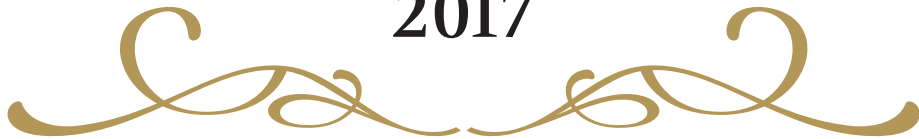
Tableau d'honneur de L'EXCELLENCE 2017