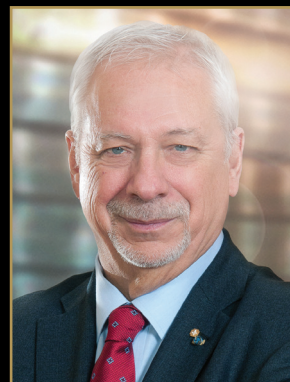
M e PIERRE MARC JOHNSON, Ad. E.

« Il appartient aux membres de notre profession de reconnaître et de dénoncer le populisme fait d'intolérance, de rejet de la différence et d'une intransigeance qui menace la démocratie et la règle de droit. »