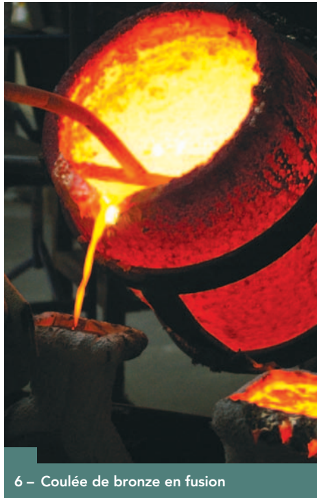
6 – Coulée de bronze en fusion

De même, la dualité, présente dans notre système contradictoire, se retrouve aussi bien dans la texture, polie ou rugueuse, que dans la teinte de la pièce patinée d'une