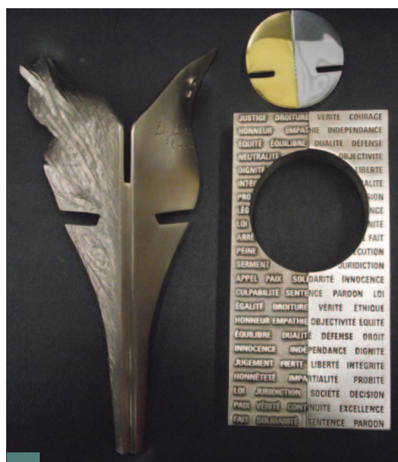
7 – Sculptures en bronze prêtes à être patinées

Cette idée de justice se retrouve aussi avec une inscription gravée et sur laquelle on peut lire « La justice éclaire