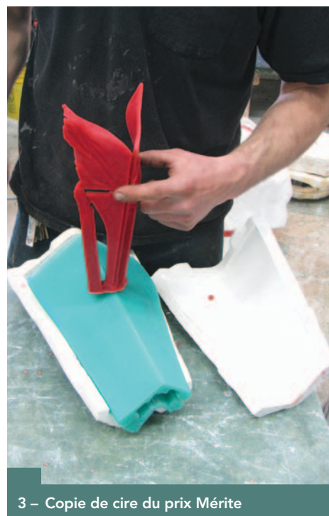
3 – Copie de cire du prix Mérite