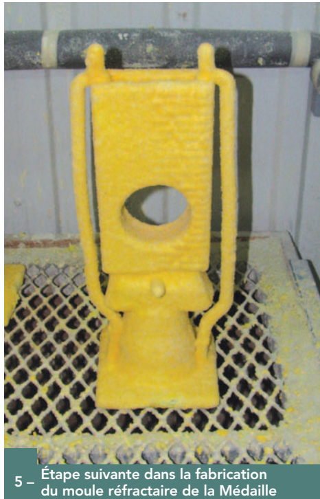
5 – Étape suivante dans la fabrication du moule réfractaire de la Médaille