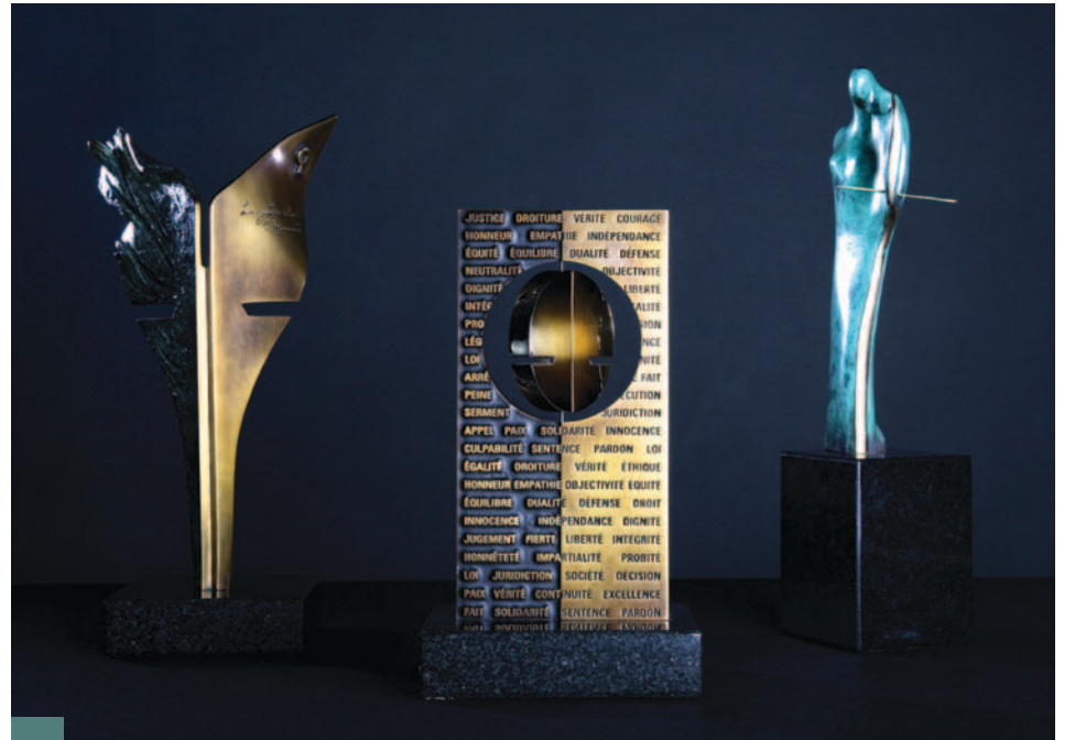
8 – De gauche à droite : le Mérite, la Médaille et le prix Christine-Tourigny