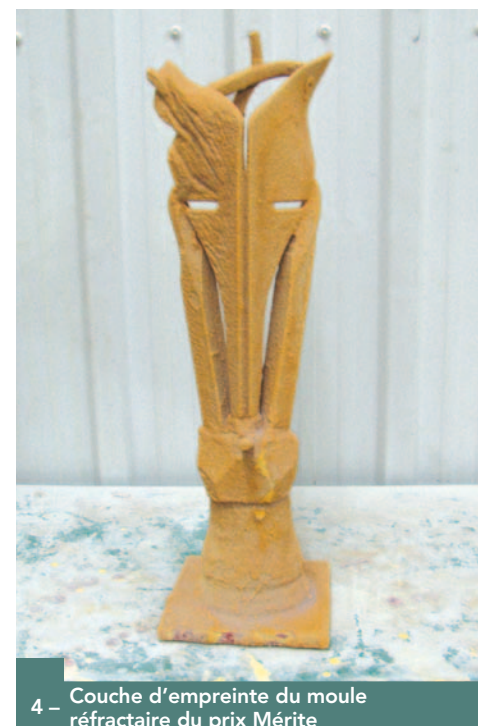
4 – Couche d'empreinte du moule réfractaire du prix Mérite